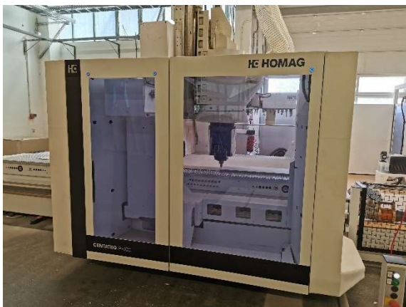
Die CNC-Maschine in Betrieb: Das Werkzeug wird positioniert.