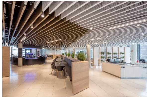
L'ORÉAL Headquarter _5

Kantinenbereich mit Kassenblock, Desserttheke und Raumtrenner mit Pflanzenhaltern.