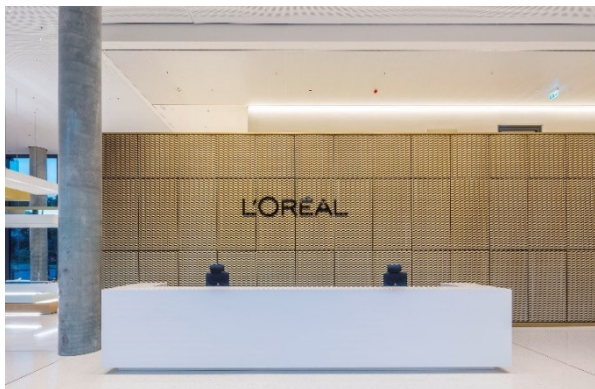
L'ORÉAL Headquarter _2

Funktionaler Empfangstresen aus Mineralwerkstoff.