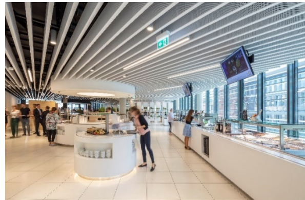
L'ORÉAL Headquarter _3

Funktionale und hygienische Kantinenausstattung.