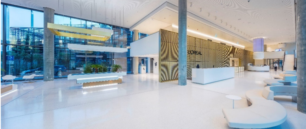
L'ORÉAL Headquarter _1